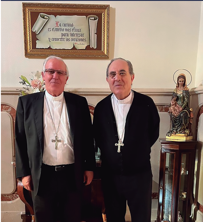
5 septiembre El arzobispo de Sevilla visitó en Sigüenza (Guadalajara) a monseñor Juan José Asenjo, arzobispo emérito de Sevilla.