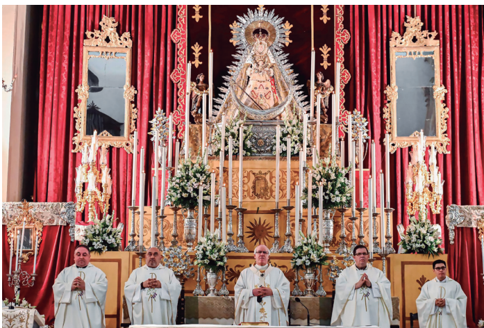
7 septiembre Eucaristía por el 25 aniversario de la coronación canónica de Nuestra Señora del Valle, patrona de Écija, en la Parroquia Santa Cruz.