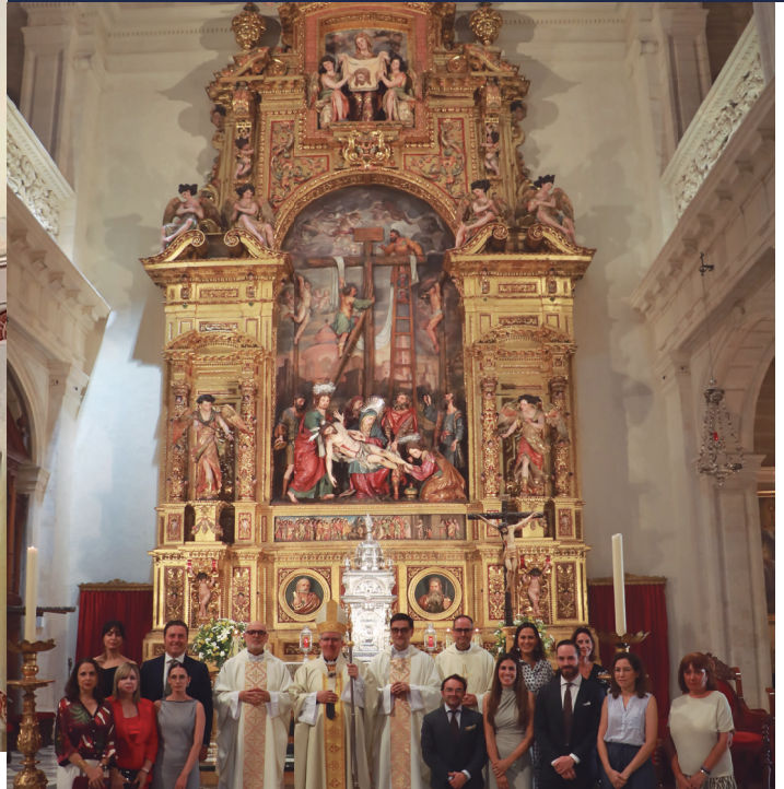
7 septiembre Eucaristía por la finalización de los trabajos de restauración del retablo de la Parroquia del Sagrario (Sevilla).