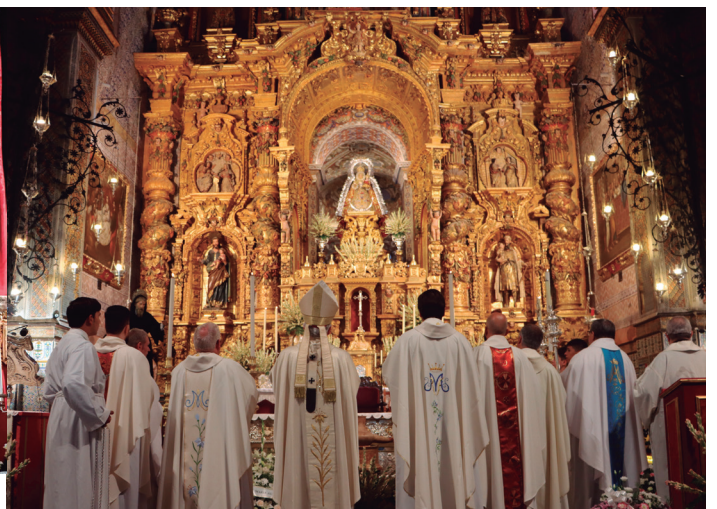
8 septiembre Eucaristía en la fiesta patronal de Nuestra Señora de Consolación, en el Santuario de Consolación, en Utrera.