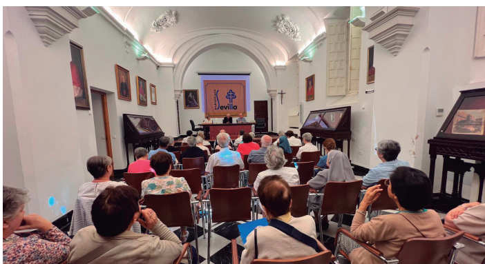
28 septiembre Inicio de curso de CONFER Sevilla en el Arzobispado.