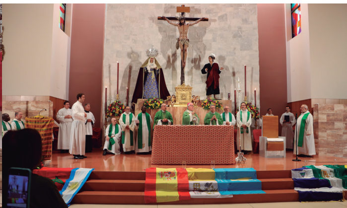
30 septiembre Jornada Mundial del Migrante y del Refugiado, en la Parroquia San Juan Pablo II, de Dos Hermanas.