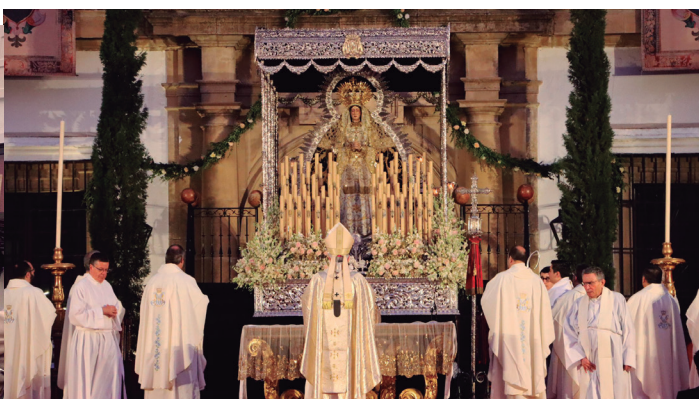
28 septiembre Coronación canónica de Nuestra Señora y Madre de la Soledad, de Marchena.