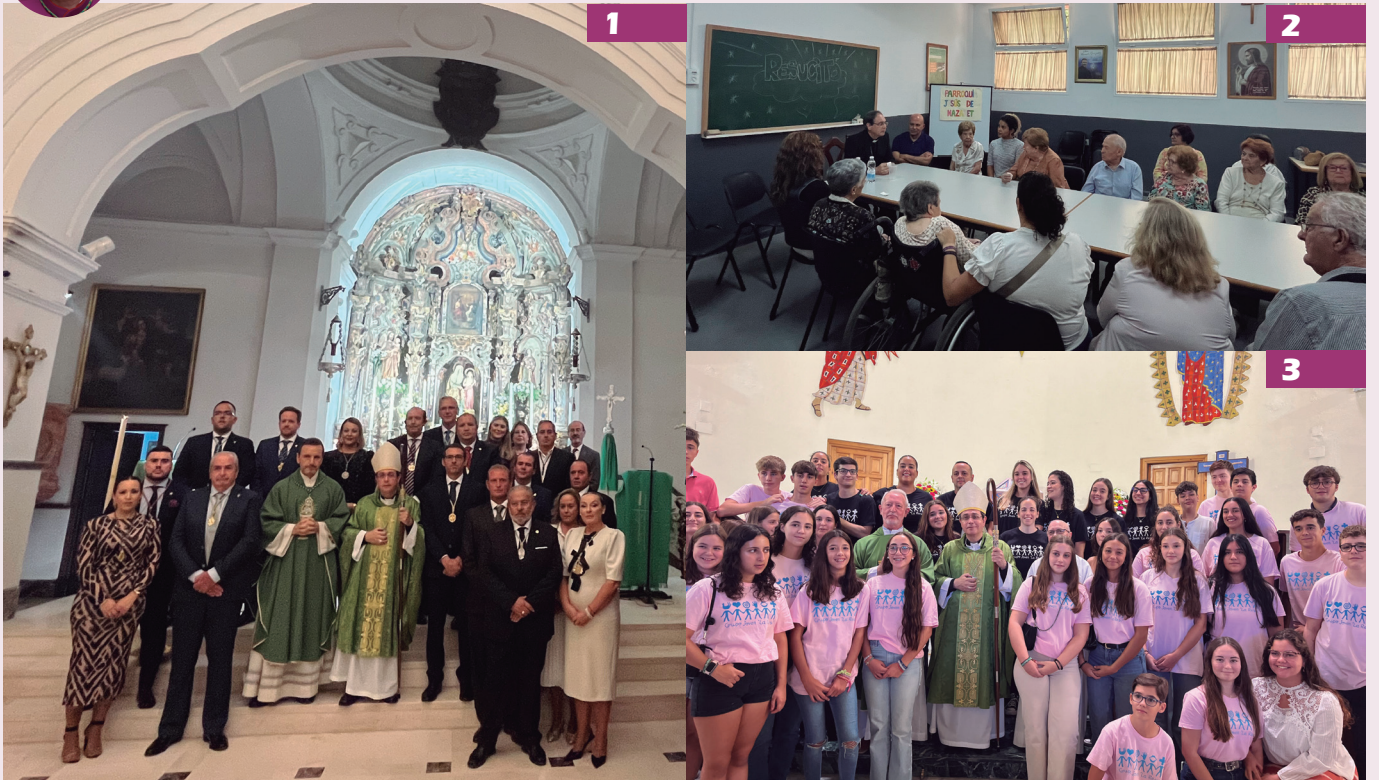
1. 28-09. Función Principal de la Hermandad de los Ferroviarios, de la Roda de Andalucía (Sevilla). 2. 26-09. Visita pastoral a la Parroquia Jesús de Nazaret y Ntra. Sra. de Consolación (Sevilla). 3. 29-09. Inicio de la visita pastoral a la Parroquia de la Resurrección del Señor (Sevilla).