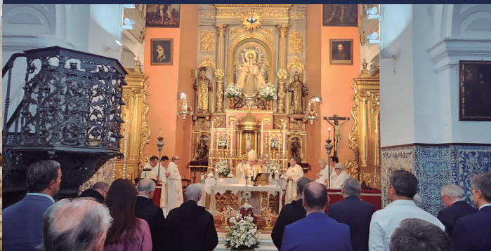
26 septiembre Eucaristía en la iglesia de San Juan de Dios por los 450 años de la Orden de San Juan de Dios en Sevilla.