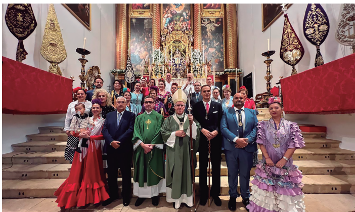
29 septiembre Eucaristía por el 50 aniversario de la Hermandad de Nuestra Señora del Rocío, de Lebrija.