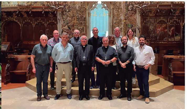
6 octubre Reunión del Organismo Mundial de Cursos de Cristiandad (OMCC) en Mallorca.