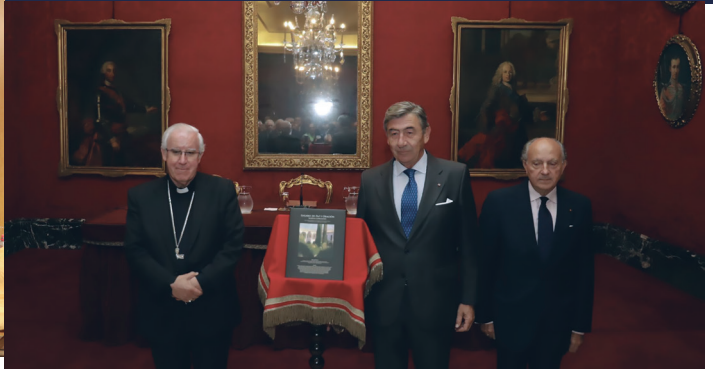
3 octubre Presentación del libro 'Lugares de paz y oración. Hortus conclusus' , en la Real Maestranza de Caballería de Sevilla.