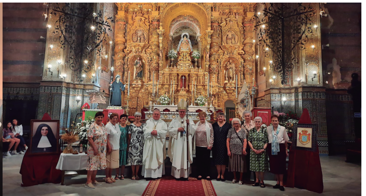
5 octubre Eucaristía por los 75 años del colegio Sagrada Familia, de Utrera, en el santuario de Ntra. Sra. de Consolación.