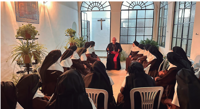
4 octubre Centenario del convento de las Hermanas de la Cruz, de Écija, fundado por Santa Ángela de la Cruz.