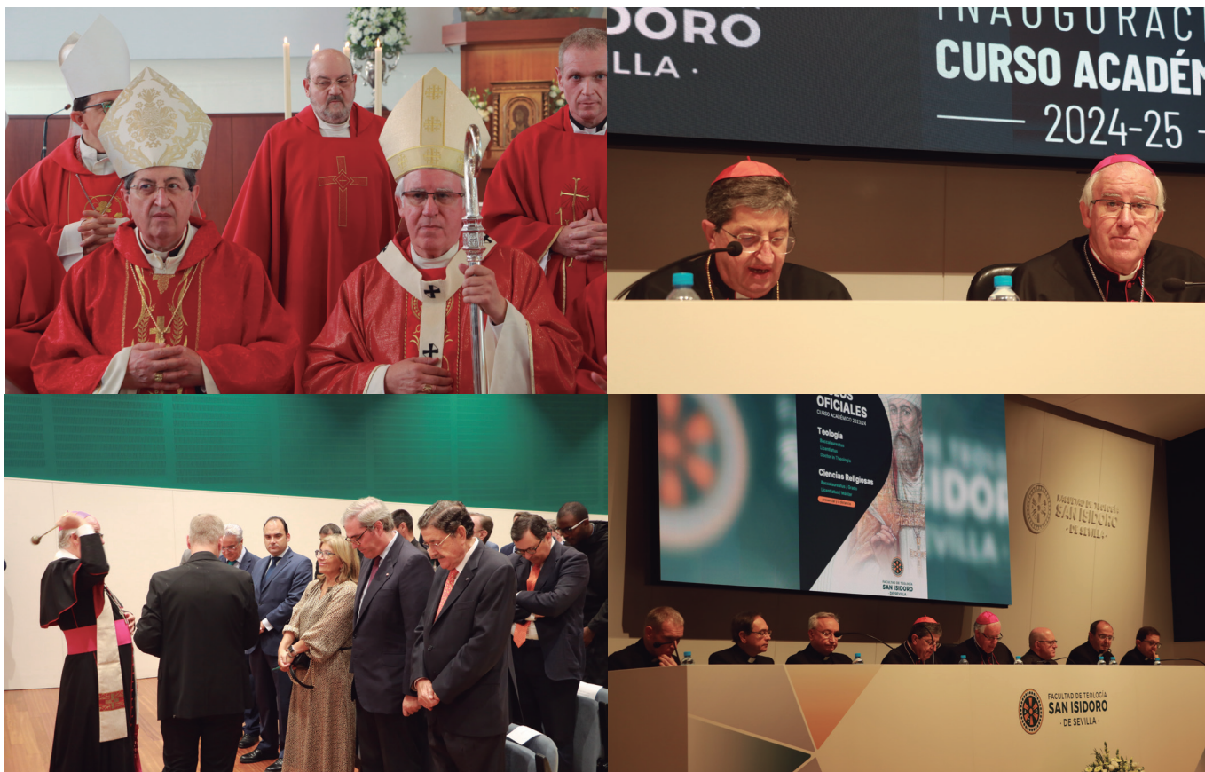
En las páginas 8 y 9, distintas instantáneas de la Misa votiva del Espíritu Santo presidida por el arzobispo de Sevilla; bendición del nuevo salón de actos de la Facultad de Teología San Isidoro de Sevilla y lección inaugural a cargo del cardenal Betori.

a cursos anteriores. Pero no solo ellos. Los alumnos que cursen los estudios a distancia van a ser testigos de este cambio, porque la facultad ha adecuado todo su espacio a un nuevo concepto audiovisual, donde destacan las plataformas online y la nueva fisonomía de las aulas y los salones de reuniones y conferencias.