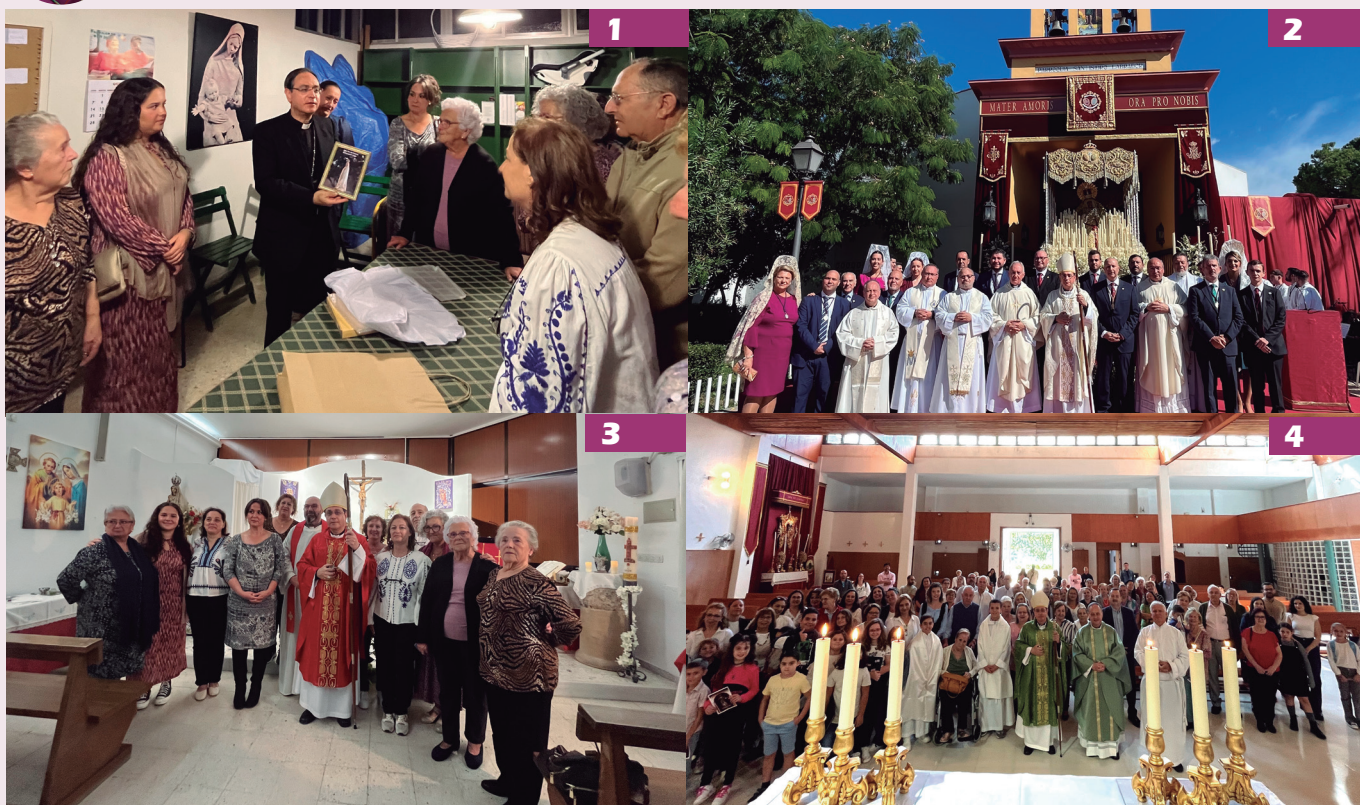
1. 18-10. Reunión con Grupo de Fátima del Aeropuerto Viejo. 2. 19-10. Conclusión de la Misión de la Hermandad del Amor de Pino Montano. 3. 18-10. Confirmaciones en la capilla Nuestra Señora de Fátima, del Aeropuerto Viejo. 4. 20-10. Apertura de la visita pastoral a la Parroquia San Francisco de Asís, Sevilla.