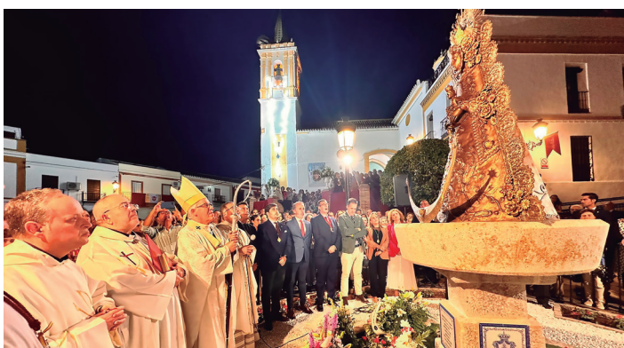
19 octubre Eucaristía por el centenario de la Hermandad del Rocío de Carrión de los Céspedes. Bendición de un monumento en honor de la Blanca Paloma.