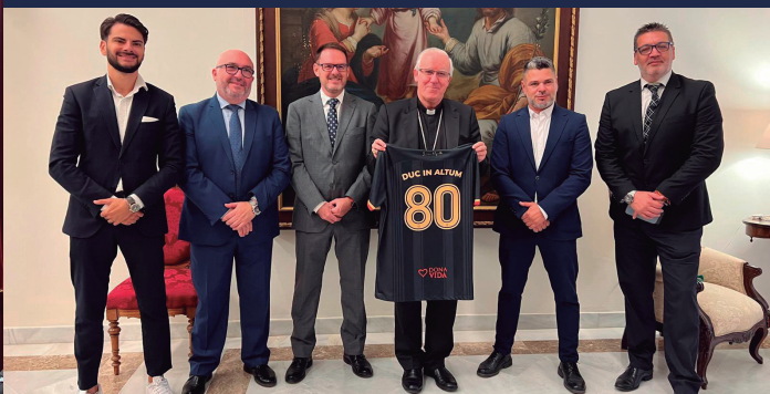
18 octubre Encuentro con la Agrupación Musical Virgen de los Reyes en el Arzobispado, donde se le ha presentado a monseñor Saiz Meneses los proyectos de la Obra Social 1980.