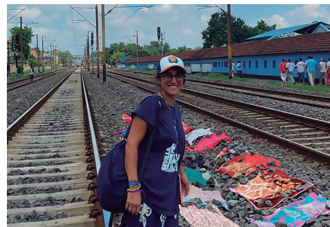
Bahía Blanca. Buenos Aires (Argentina), 1995 | Es consultora de Recursos Humanos

La misión duró 17 días y afirma que “es un voluntariado muy distinto a lo que estamos acostumbrados”. Las sisters son las encargadas de asignar a los voluntarios las casas a donde hay que asistir y “vas allí a ayudar en lo que haga falta, dependiendo de la casa que te toque son unas funciones u otras, pero la mayoría sencillas”.