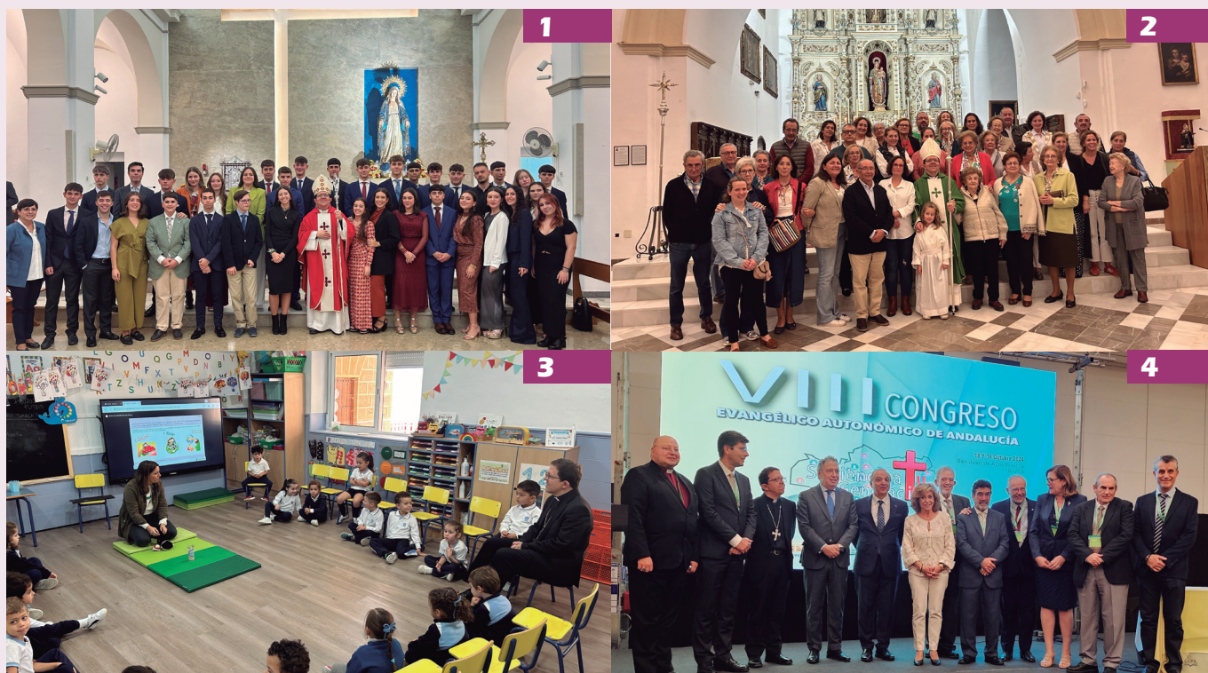
1. 18-10. Confirmaciones en el colegio Ntra. Sra. del Rosario de Triana. 2. 20-10. Visita pastoral a la Parroquia Nuestra Señora de Consolación, de El Pedroso. 3. 19-10. Visita al Colegio Safa, de Osuna. 4. 19-10. Encuentro con el Consejo Evangélico Autnómico de Andalucía.