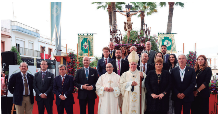
19 octubre 400 aniversario de la hechura del Santísimo Cristo de la Vera Cruz de la Hermandad de la Santa Vera Cruz, de Las Cabezas de San Juan.