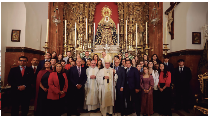
20 octubre Confirmaciones de catecúmenos de la Hermandad de la Esperanza de Triana, en la Capilla de los Marineros.