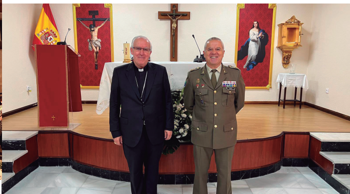
18 octubre Visita a la sede de la Segunda Subinspección General del Ejército Sur en Sevilla y bendición de la nueva capilla.