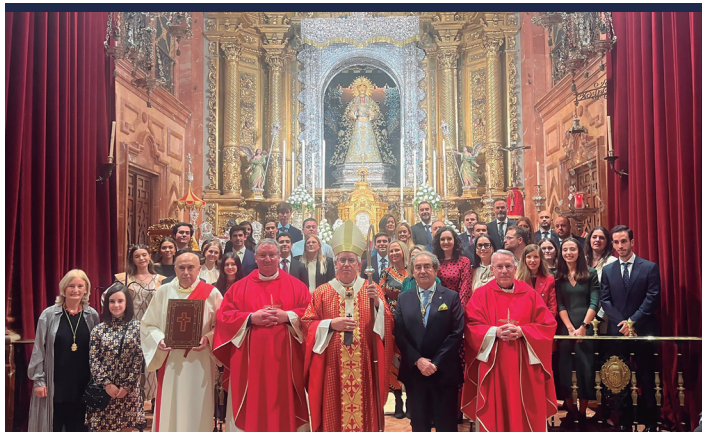
17 octubre Confirmaciones en la Basílica de Santa María de la Esperanza Macarena.