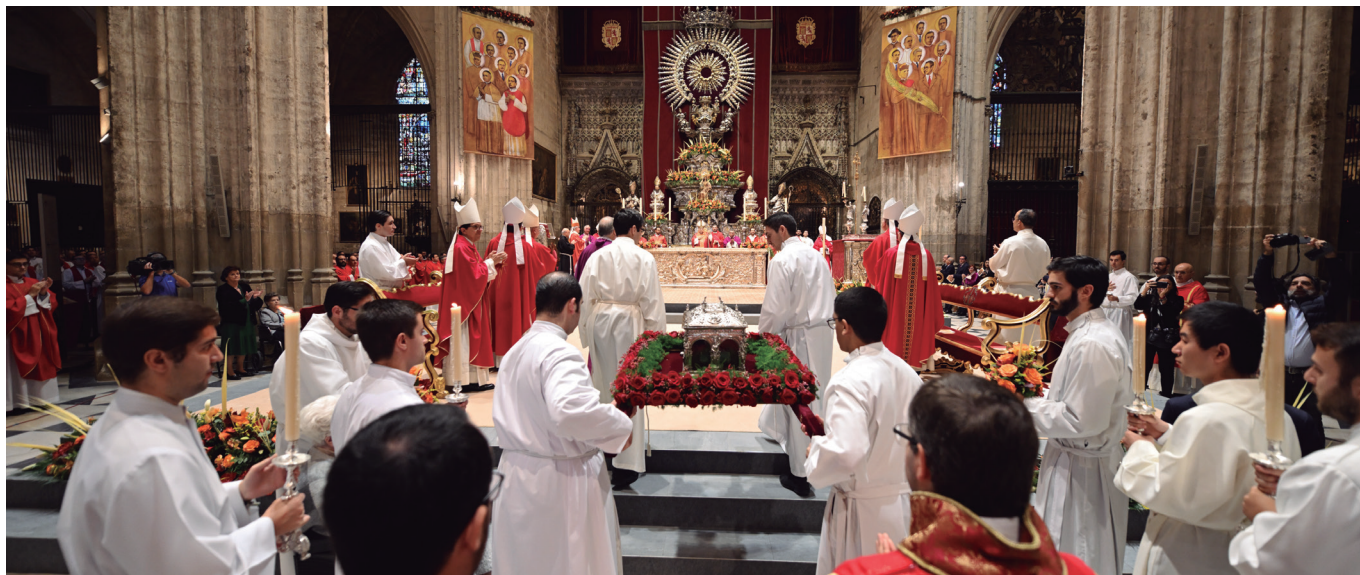
En la página 8, M o del Monte Chacón en un momento de la entrevista. En esta página, beatificación de los mártires sevillanos del siglo XX, en la Catedral de Sevilla, el 18 de noviembre de 2023.