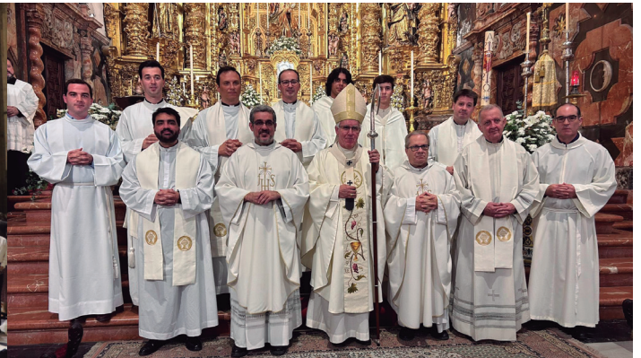
22 octubre Eucaristía por el 300 aniversario de la consagración del templo parroquial de Santa María Magdalena, de Sevilla.