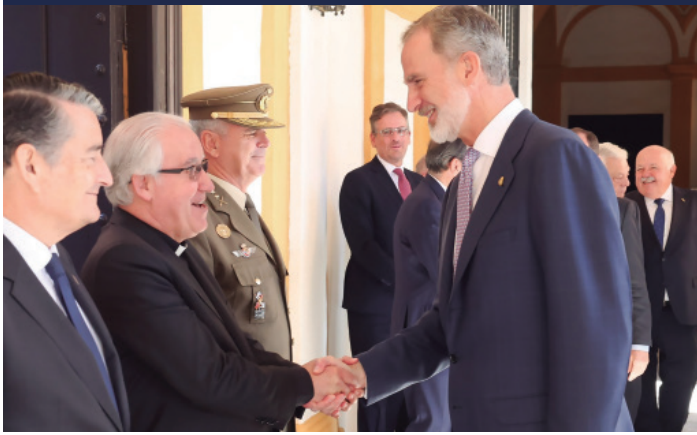
21 octubre Saludo a S.M. Felipe VI, en el Real Alcázar de Sevilla, con motivo del Premio Extraordinario Iberoamericano Torre del Oro.