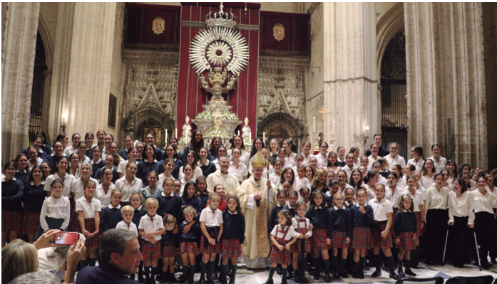
21 octubre Eucaristía por el 50 aniversario del colegio Entreoilivos, en la Catedral de Sevilla.