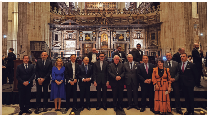
23 octubre Presentación del himno del II Congreso Internacional de Hermandades y Piedad Popular, en el trascoro de la Catedral.