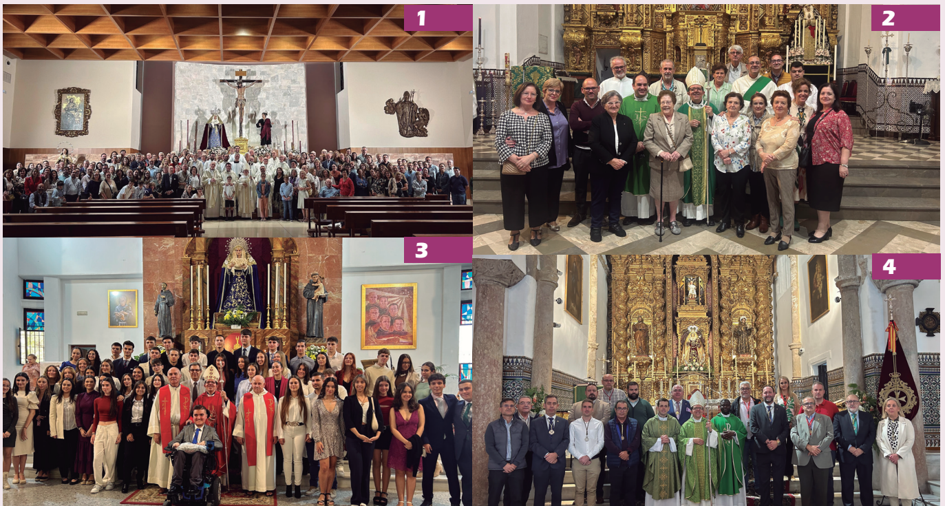
1. 22-10. Eucaristía en la Parroquia San Juan Pablo II, de Montequinto, en la festividad de su santo titular. 2. 25-10. Eucaristía en la Parroquia Santa María de la Asunción, de Mairena del Alcor, organizada por la Asociación Provida de la localidad. 3. 26-10. Confirmaciones en la Parroquia Ntra. Sra. de los Desamparados, de Parque Alcosa. 4. 27-10. Eucaristía de clausura del Congreso de Hermandades de Getsemaní, en Sanlúcar la Mayor.