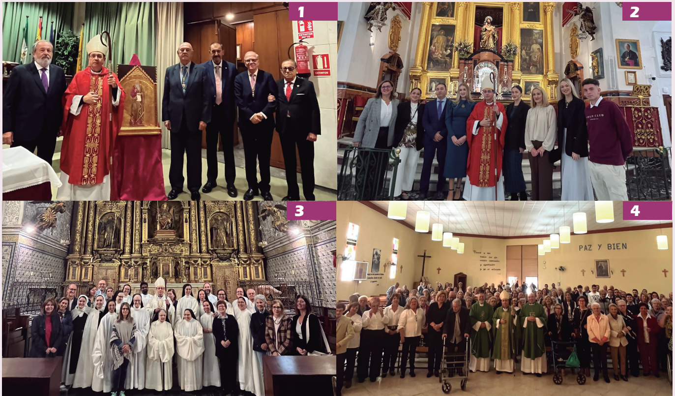
1. 25-10. Eucaristía en el Colegio de Médicos de Sevilla. 2. 25-10. Confirmaciones en la iglesia del Señor San José, de Sevilla. 3. 26-10. Eucaristía en el convento San Clemente, de Sevilla. 4. 27-10. Inicio de la visita pastoral a la Parroquia San Isidro Labrador, de Sevilla.