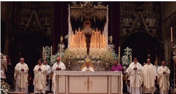
1 noviembre 25 Aniversario de la Coronación Canónica de la Virgen de la Estrella, en la Catedral de Sevilla con la presencia de monseñor Baltazar Porrás Cardozo, arzobispo emérito de Caracas, que estuvo presente en la coronación.