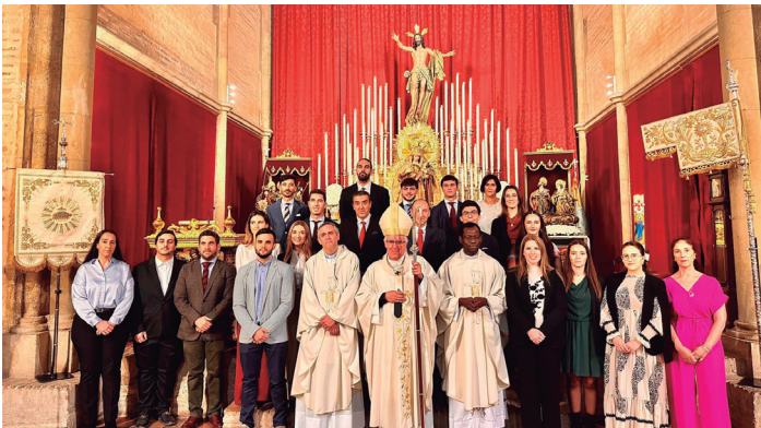
31 octubre Confirmación de catecúmenos de la Parroquia Omnium Sanctorum, en la iglesia de Santa Marina.