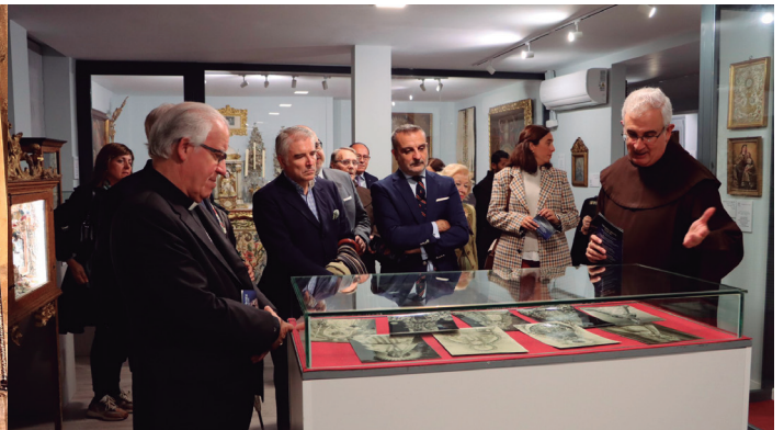
31 octubre Inauguración de la exposición 'Imagen vestida, imagen pintada. Arte y atuendo en las imágenes sagradas', en el Museo del Santo Ángel, de Sevilla.