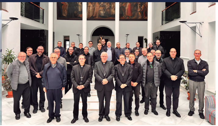
31 octubre Reunión del Consejo Presbiteral de la Archidiócesis de Sevilla, en la casa de Espiritualidad 'Betania'.