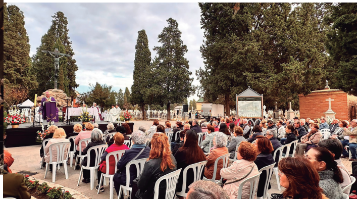
2 noviembre Conmemoración de todos los Fieles Difuntos en el cementerio de San Fernando de Sevilla.