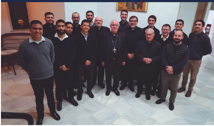
29 octubre Visita al Seminario 'Redemptoris Mater', de Sevilla.