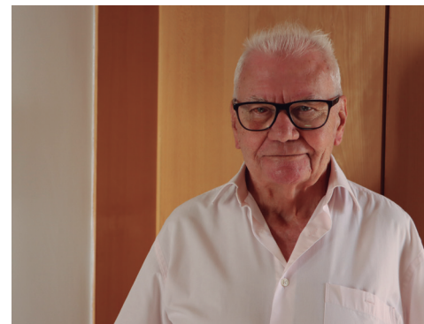
Zalamea La Real (Huelva), 1937 | Sacerdote jubilado, reside en la Casa Sacerdotal ‘Santa Clara’

Sobre su oración personal en este momento reconoce que es “muy serena y bonita, porque veo cómo mi historia personal está rodeada de